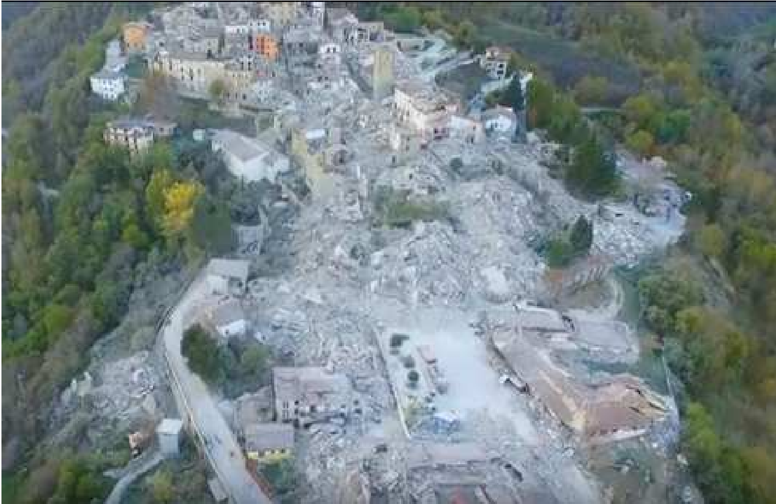
Fotogramma estratto da una ripresa effettuata con drone dalla Protezione Civile su Accumoli dopo la scossa del 30/10/2016