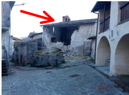
Chiesa di San Giovanni (XVI sec.)