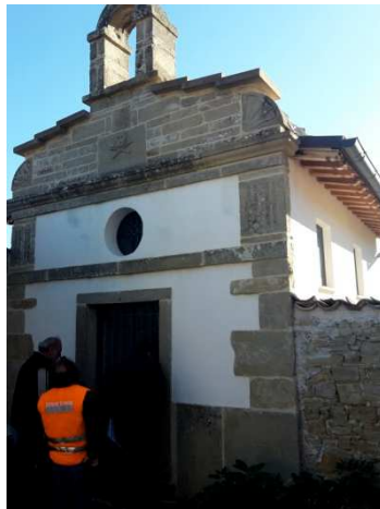
Cimitero di Collespada (foto 28/10/2016)