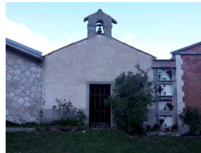
Cimitero di Terracino (foto 28/10/2016)