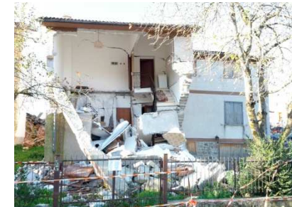
Saletta (foto 28/10/2016)