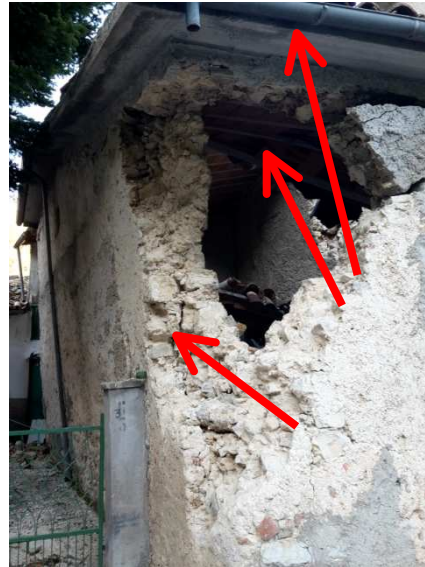
Frazione di San Giovanni (28/10/2016)