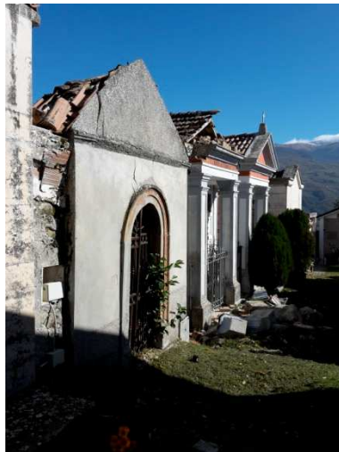
Cimitero di Accumoli (foto 28/10/2016)

Tale attività di verifica ci ha consentito di effettuare sopralluoghi in quasi tutte le frazioni (il centro storico di Accumoli è inaccessibile senza autorizzazione dei VV.FF. o della Protezione Civile).